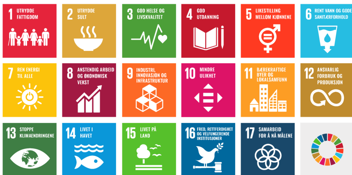
Figur 1 FNs 17 bærekraftsmål.

I 2015 vedtok FNs generalforsamling 2030-agendaen for bærekraftig utvikling. Agendaen har 17 utviklingsmål for å fremme sosial, miljømessig og økonomisk bærekraft. FNs bærekraftsmål