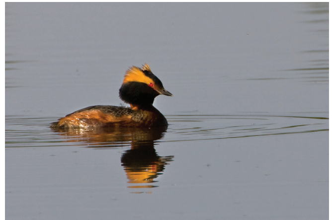
Horndykker er en art som øker i antall med økt tilgang på gårdsdammer.

1990-tallet at man forstod alvoret i at gårdsdammene var i ferd med å forsvinne fra kulturlandskapet. Det ble derfor etterhvert etablert ordninger der man kunne få støtte til å restaurere gamle dammer eller anlegge nye.