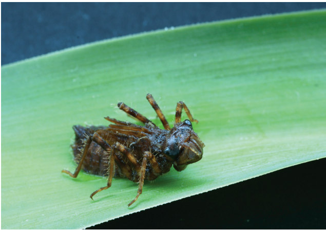
Øyestikkernymfer er viktige rovdyr nede i gårdsdammene.

både insekter og amfibier. Derfor er det viktig å forhindre at fisk etablerer seg i gårdsdammene.