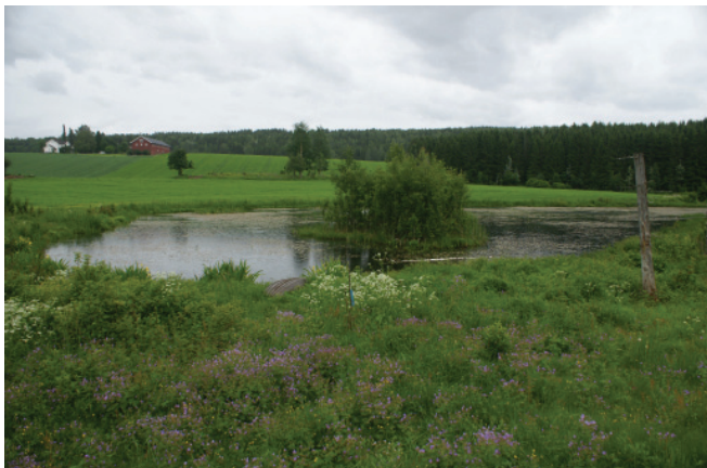
Gårdsdam fra Stange i Hedmark.

Jordbruket i Norge fram mot midten av 1800-tallet dreide seg hovedsakelig om husdyrhold. Derfor ble gårdene ofte etablert i forbindelse med tjern, bekker eller elver. Dette sikret en god og stabil vanntilførsel til gårdsdriften. Det ble også gravd ut gårdsdammer som skulle sikre tilgang til vann for husdyra. Tilsig av næringsstoffer fra jordbruksdrifta dannet grunnlaget for utviklingen av et rikt plante og dyreliv i gårdsdammene. Men ettersom antallet husdyr i Norge minket i tiden etter 1940-årene, forsvant behovet for gårdsdammene og de ble etter hvert fylt igjen. I tillegg fikk brønnoven av 1957 store negative konsekvenser for dammene i kulturlandskapet. Strenge krav til sikring av dammene gjorde at mange grunneiere fant det rimeligere å fylle igjen dammene. Det var først på begynnelsen av