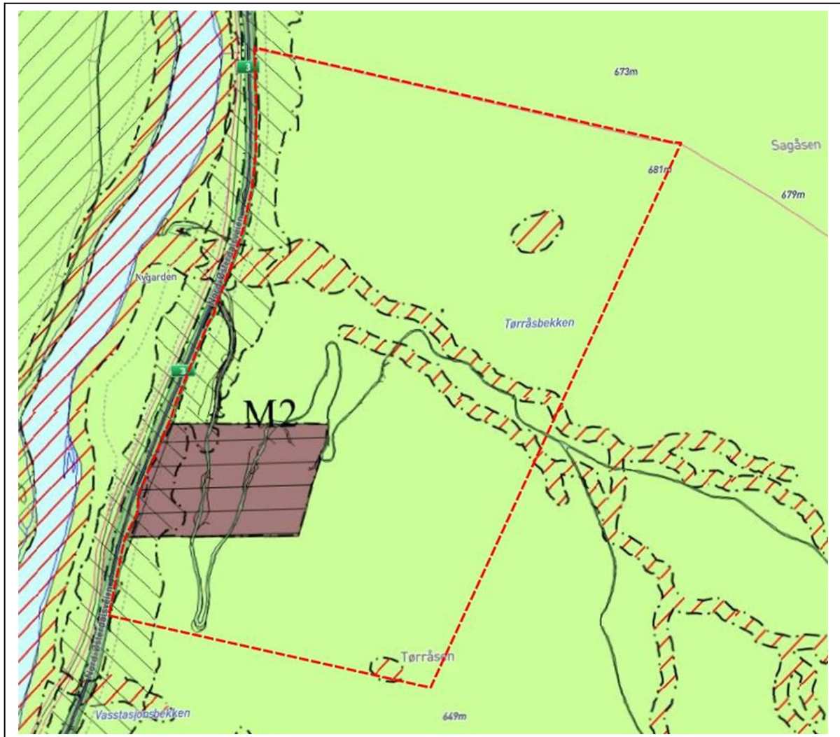
Kart nr.2: Utsnitt fra kommuneplanens arealdel. Varslingsgrense vises med rød stiplet strek.

I kommuneplanens arealdel, med ikrafttredelsesdato 26.06.14, er planområdet avsatt til arealformålene massetak og LNF(R) (landbruk, natur, friluftsliv og reindrift), dvs. ordinært LNF(R)-område.