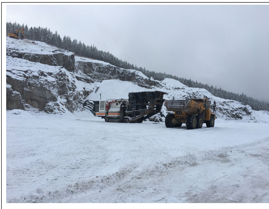
Eksisterende drift i fjelltaket.